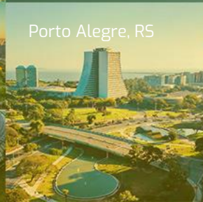
Porto Alegre, RS