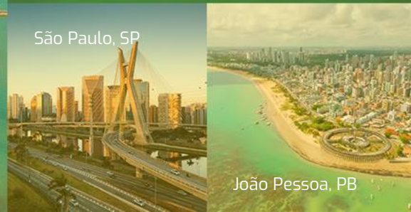
São Paulo, SP