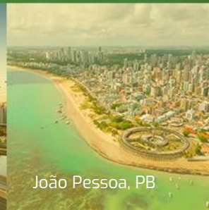
João Pessoa, PB