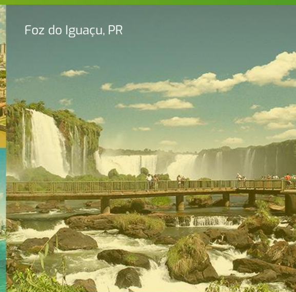
Foz do Iguaçu, PR