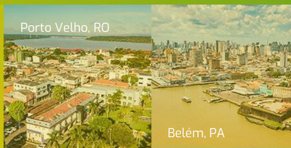
Porto Velho, RO