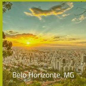
Belo Horizonte, MG

#conectando as diversas necessidades temáticas às cinco regiões do país