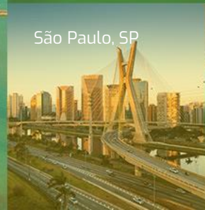
São Paulo, SP