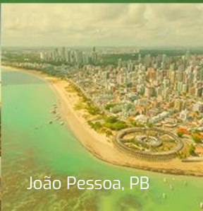
João Pessoa, PB